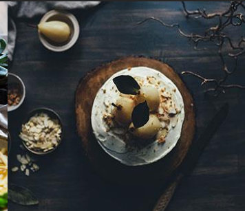
Descreva o prato aqui