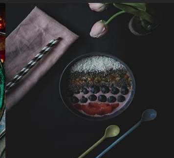
Descreva o prato aqui