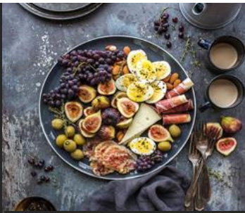
Descreva o prato aqui

Quando a imagem que pretende substituir estiver selecionada, pode seleccionar "Alterar Imagem" no menu de contexto ou clicar na opção "Preenchimento" e, em seguida, seleccionar a opção "Imagem".