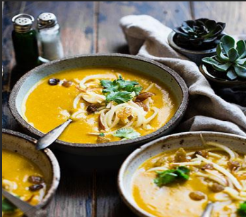
Descreva o prato aqui