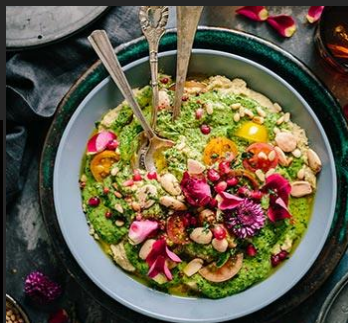
Descreva o prato aqui