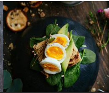
Descreva o prato aqui